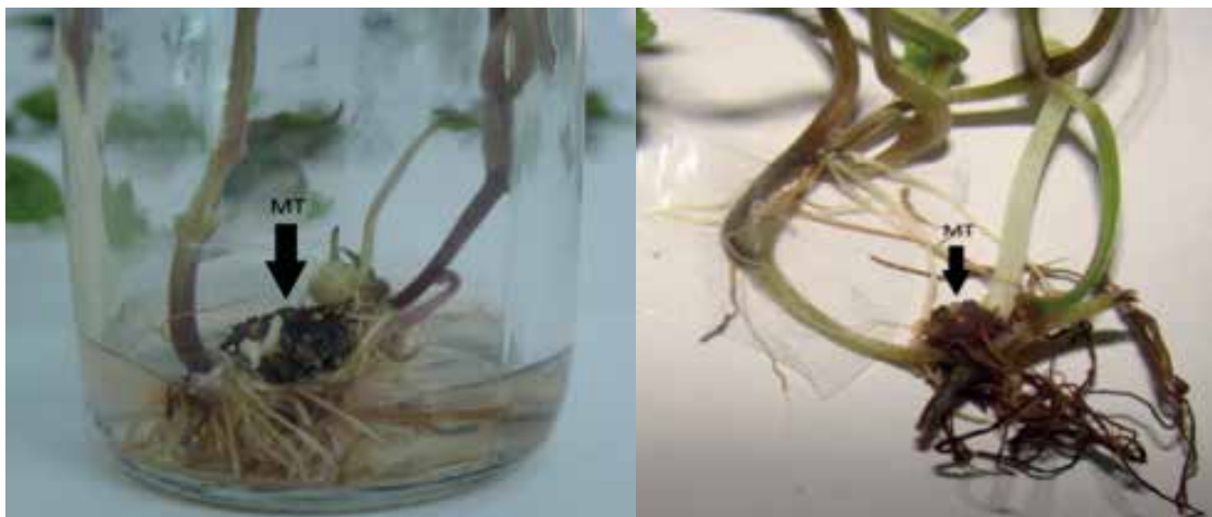
Figura 1: Plantas de ñame in vitro con formación de microtúberos en la base del tallo (MT).

La formación de microtubérculos se observó en plantas cultivadas en medio con dosis altas ( 2,0 \text{ mg L}^{-1} y 3,0 \text{ mg L}^{-1} ) de ABA, mientras que en aquellas cultivadas en medio con \leq 1 \text{ mg L}^{-1} de ABA no se formaron estas estructuras. El mayor porcentaje de microtuberización (65%) se observó en las plantas cultivadas en el medio MS con 60 \text{ g L}^{-1} de sacarosa y 3,0 \text{ mg L}^{-1} ABA, seguido por las plantas cultivadas en los medios que contenían 60 \text{ g L}^{-1} de sacarosa y 2,0 \text{ mg L}^{-1} ABA (13%) y las cultivadas en presencia de 30 \text{ g L}^{-1} de sacarosa con 2,0 \text{ mg L}^{-1} ABA, y 90 \text{ g L}^{-1} de sacarosa combinada con 3,0 \text{ mg L}^{-1} ABA (11%) (Figura 2).