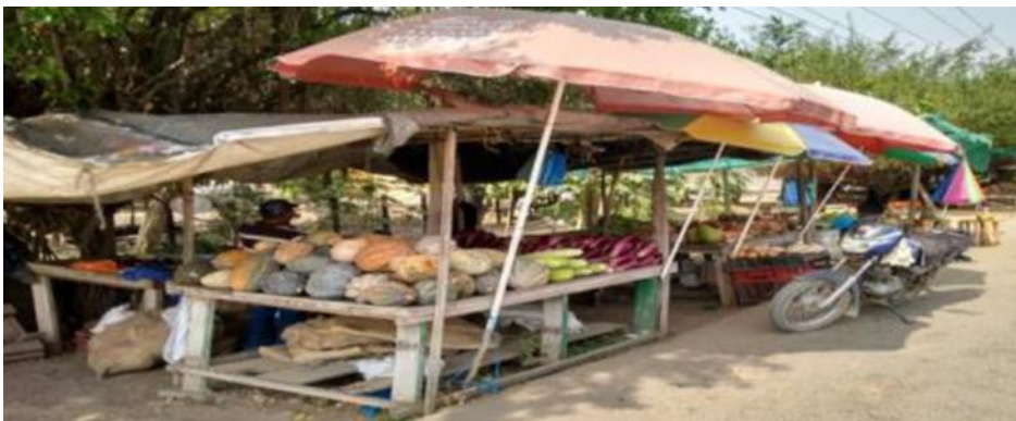
Ilustración 3 comerciantes ambulantes estacionarios. (CEREABASTOS 2019)

Este plan de mejoramiento, se enfocará en el área de cartera de la dirección de CEREABASTOS del Municipio De Cerete, con el fin de mejorar el sistema de recaudo al momento del cobro de cartera, evitando con esto llegar a una cartera de difícil recuperación, con este propósito se diseñaran planes de contingencia que contribuyan a la disminución de este indicador.