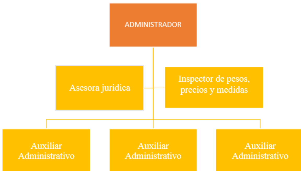
Ilustración 2. Organigrama CEREABASTOS (administración de Cereabastos)