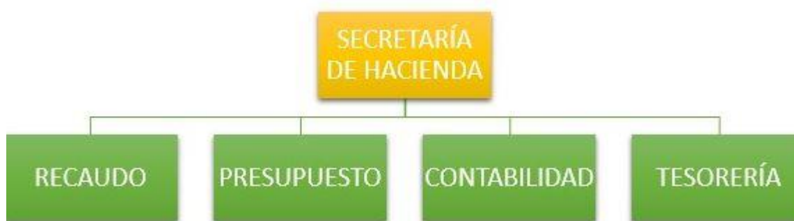
Figura 2 Organigrama de la Secretaría de hacienda