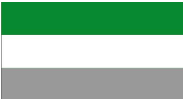
Ilustración 2 Bandera de la Alcaldía Municipal de Montelíbano